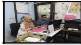
รูป (ข้อที่ 2)