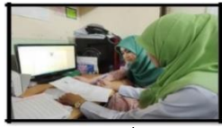
รูป (ข้อที่ 1)